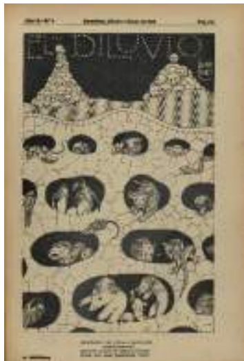
©Arxiu Històric de la Ciutat de Barcelona. Bru-Net El Diluvio.