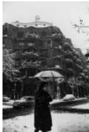
Autor: Xavier Miserachs

La UNESCO la inscriu com a Bé cultural del patrimoni mundial pel seu valor universal excepcional (ref. 320bis.).